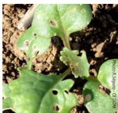
Morsures d'altise d'hiver sur plantule de colza –

En journée, l'insecte est peu visible. La mise en place de cuvette jaune « enterrée » (piège d'interception) est un bon indicateur de présence (les altises ne sont cependant pas attirées par la couleur jaune).