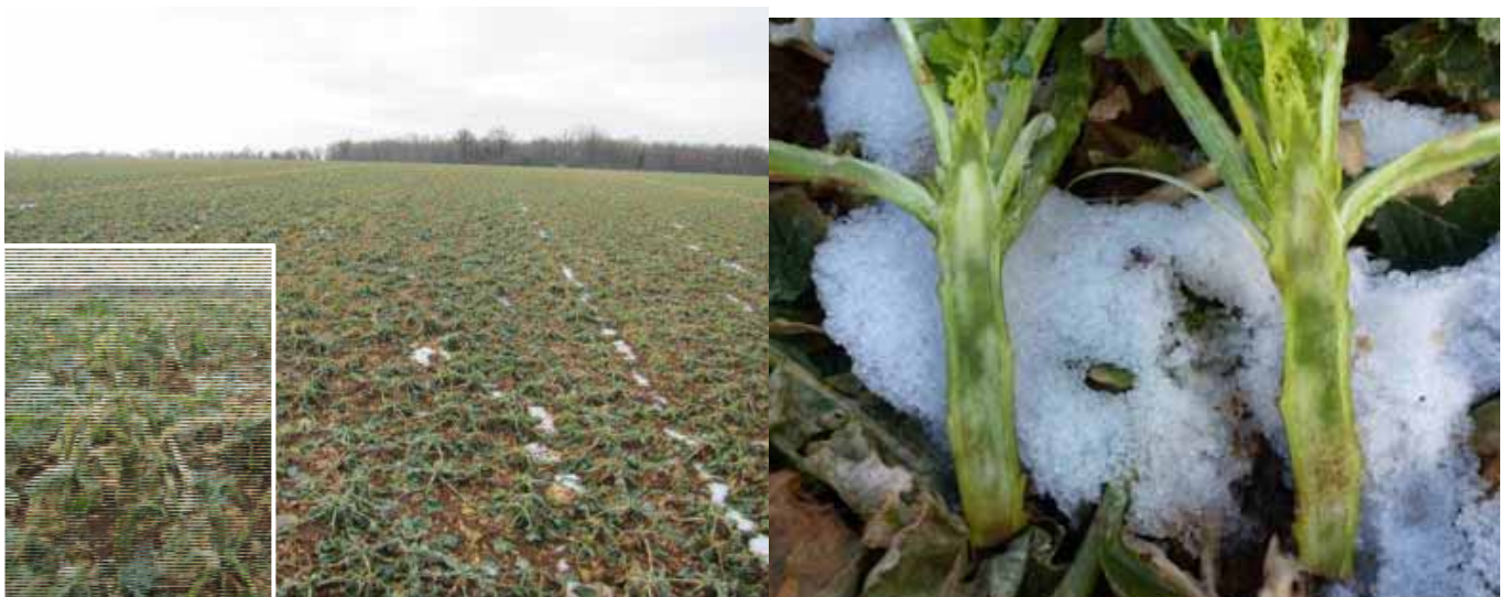
Dégâts de gel sur zone élonguée

Cependant, les plantes avec de fortes élongations (> 10 cm) sont les plus vulnérables ou touchées.