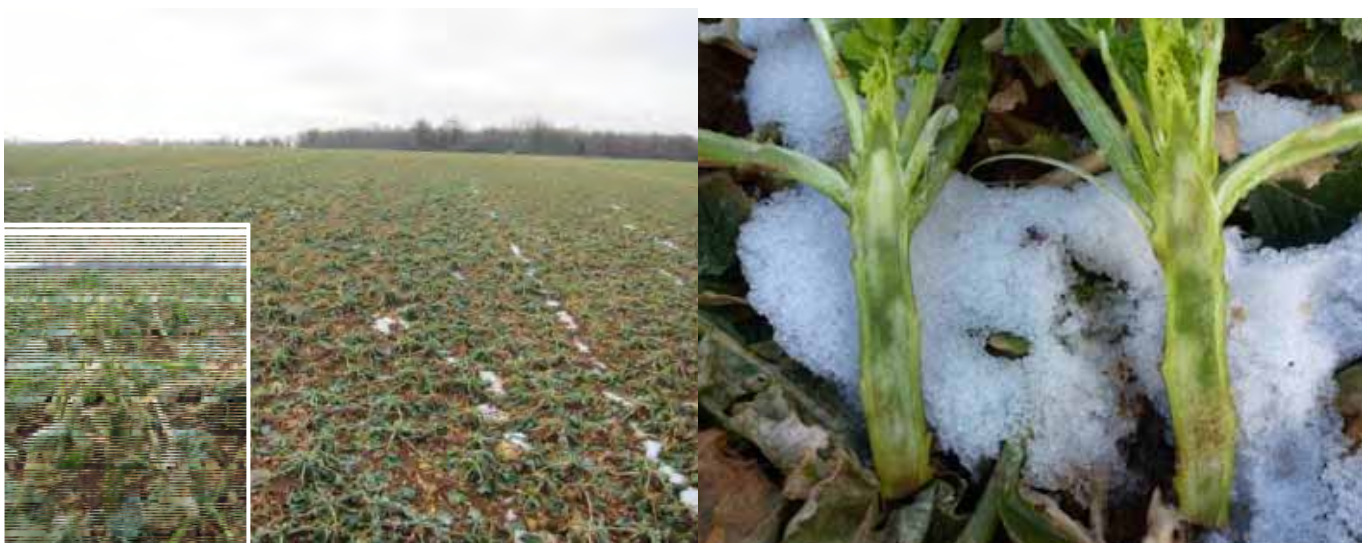
Dégâts de gel sur zone élonguée

Les plantes avec de fortes élongations seront les plus touchées par le gel.