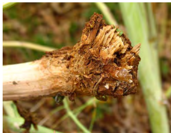
Nécrose au collet

Le phoma est une maladie que l'on peut retrouver tout au long du cycle du colza.