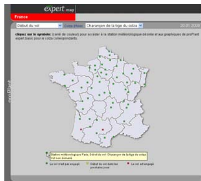
proPlant Expert Map

Accéder à proPlant Expert Cliquez sur le lien