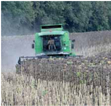
Les récoltes 2011 se sont déroulées dans de bonnes conditions, mais il ne fallait pas tarder à récolter.

Lorobanche cumana a continué à se développer dans les zones où elle était déjà connue mais également sur d'autres secteurs du Sud-Ouest. Ce parasite spécifique du tournesol doit être contrôlé pour éviter que les infestations actuelles ne s'étendent largement. La présence de tournesols sauvages a été signalée dans les parcelles, avec de nouvelles infestations. Les producteurs ayant été confrontés à ce problème devront donc être particulièrement vigilants dans les années à venir et utiliser tous les moyens disponibles pour en limiter le développement.