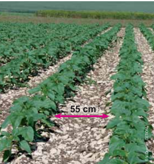
La régularité du peuplement prime sur la densité.

La qualité de l'implantation dépend non seulement d'un sol suffisamment réchauffé mais également d'une densité et d'un écartement appropriés.